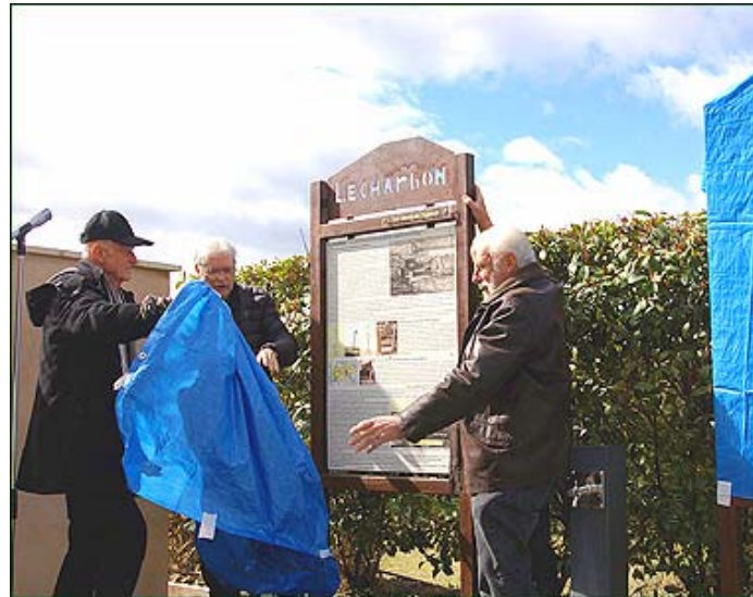
Dévoilement du panneau "LE CHARBON".