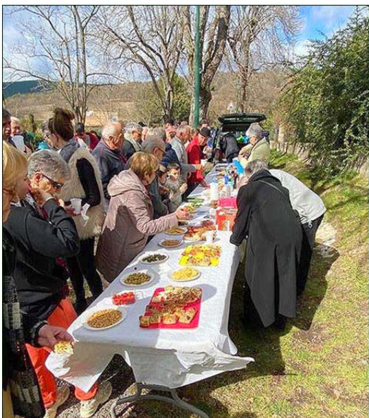
Un buffet bien garni pour fêter l'événement.

Merci pour votre aide dans la publication de cet article et dans la réalisation de cette journée.