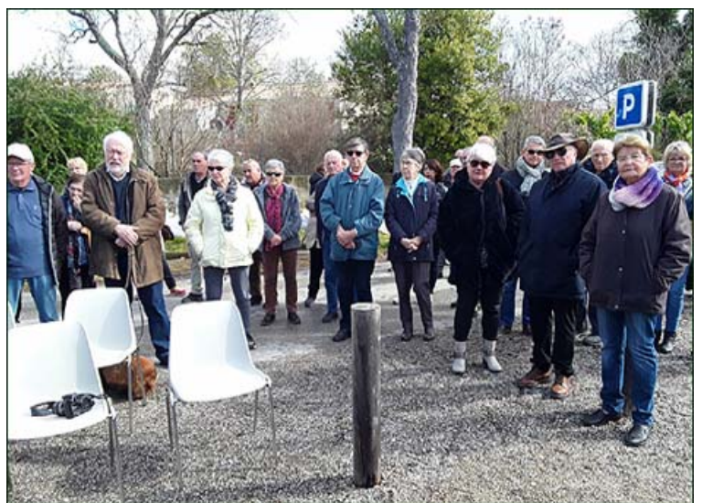
L'assistance était très intéressée par cette inauguration commémorative du passé industriel de Sigonce.