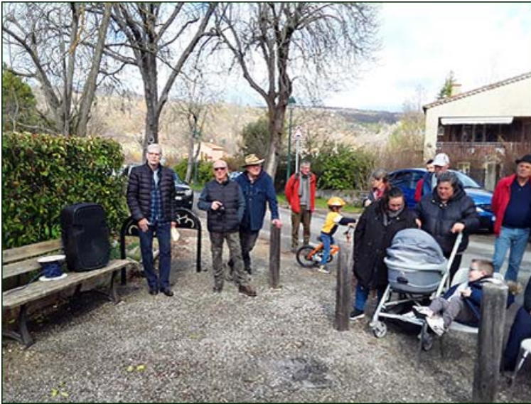
Une partie de la nombreuse assistance.