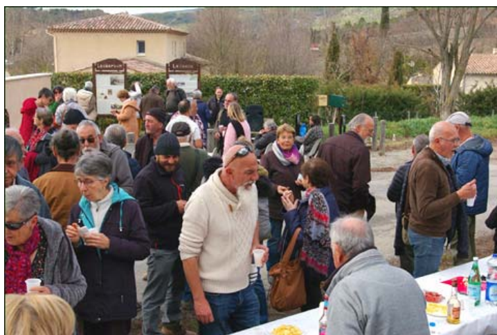
Discussion dans l'assistance entre les invités.