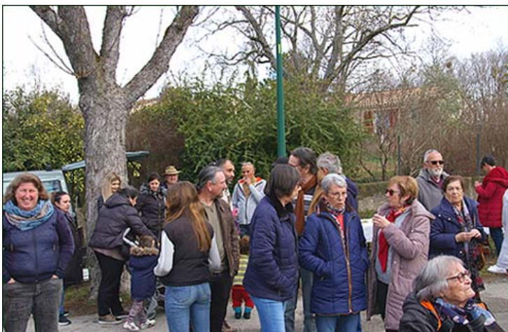
Échanges entre participants.