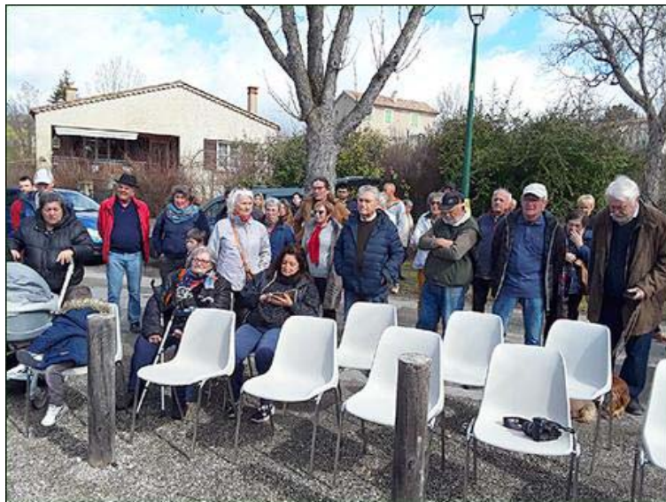
Une autre partie de l'assistance.