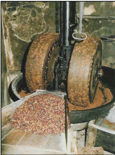
Les meules en action.