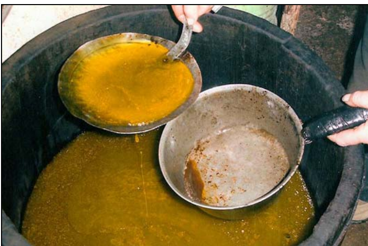
Ramassage de l'huile à la feuille et à la casserole au dessus d'une barrière en bois.

On pourra constater, sur la photo de droite, l'action du vérin qui exerce une force de pressage verticale sur les scourtins (le point fixe est en haut) et la première huile qui s'en écoule. C'est enfin la décantation dans des énormes barrières (bacs en bois) où le ramassage de l'huile se fera en fin d'opération à la feuille (sorte d'écumoire non percée, un peu creuse au milieu) et à la casserole.