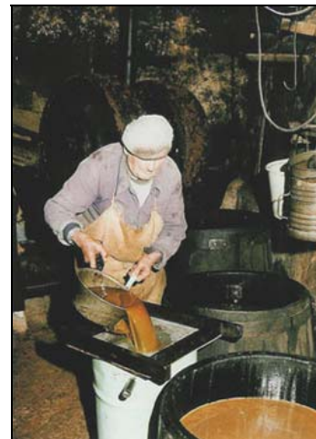
L'huile récoltée sera vidée sur un tamis.

L'huile sera ensuite filtrée et après s'être reposée sera prête à la consommation.