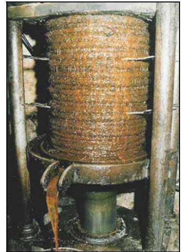
L'opération de pressage

On pourra constater, sur la photo de droite, l'action du vérin qui exerce une force de pressage verticale sur les scourtins (le point fixe est en haut) et la première huile qui s'en écoule. C'est enfin la décantation dans des énormes barrières (bacs en bois) où le ramassage de l'huile se fera en fin d'opération à la feuille (sorte d'écumoire non percée, un peu creuse au milieu) et à la casserole.