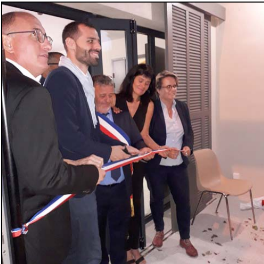
La coupure du ruban.

Je vous invite à prendre le verre de l'amitié. »