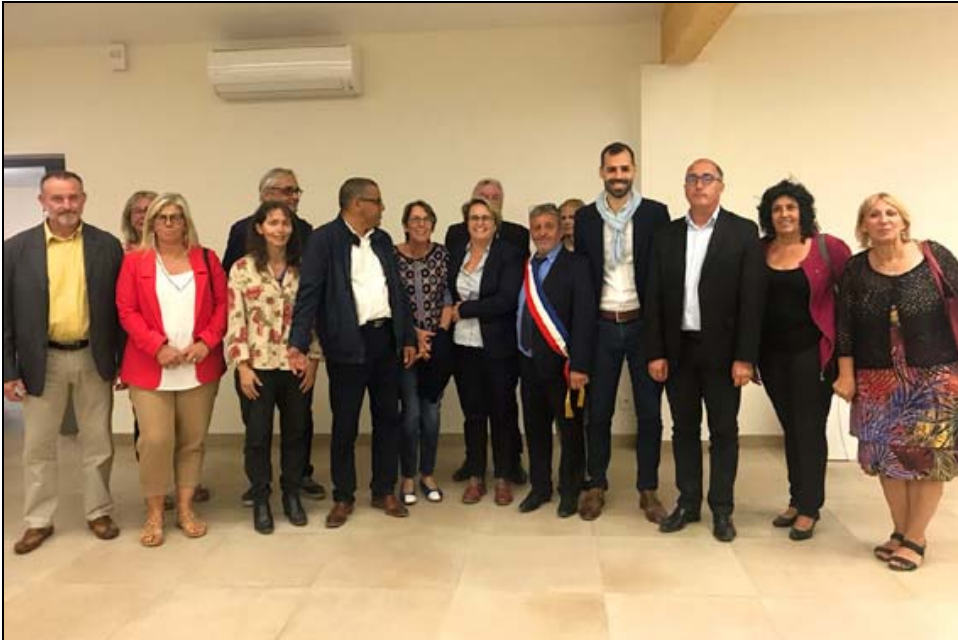
Les personnalités dans la nouvelle salle Barrière du Lauzon.