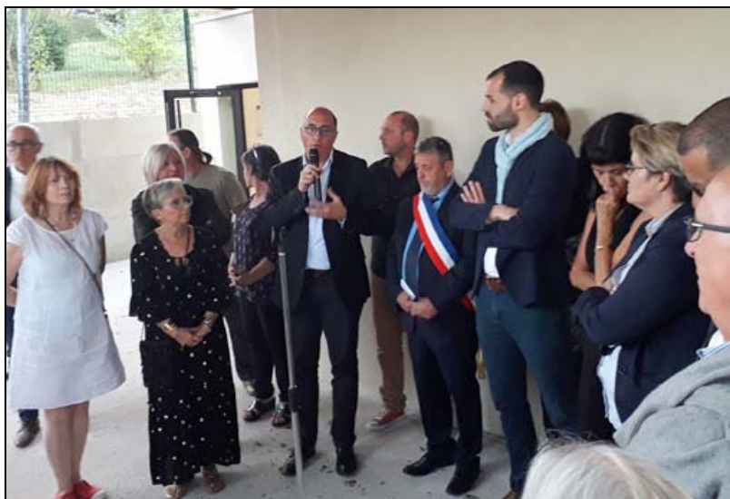
M. Jean-Yves Roux, Sénateur, en plein discours.