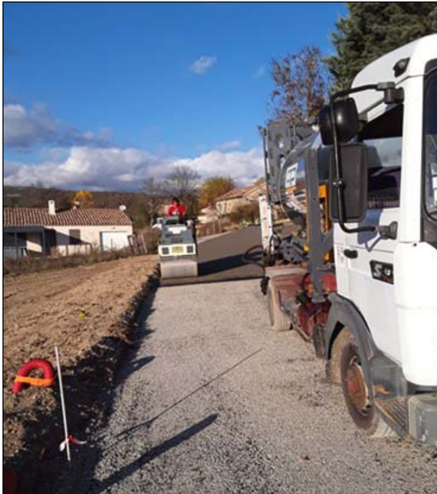
La goudronneuse à droite attend de rentrer en action.

Dorénavant le car scolaire empruntera cette nouvelle voie. Les élèves le prendront au niveau de l'atelier communal et non plus devant le portail de l'école comme à l'accoutumée.