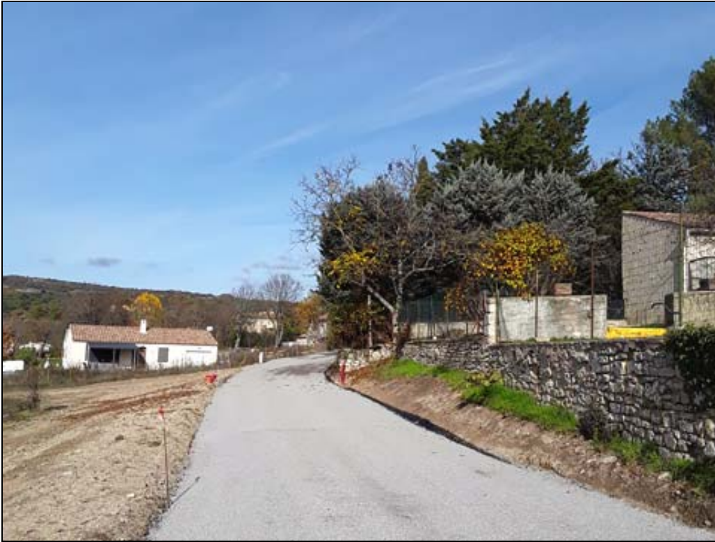
Une portion de la nouvelle voie de circulation appelée : "Chemin des Ferrayes".