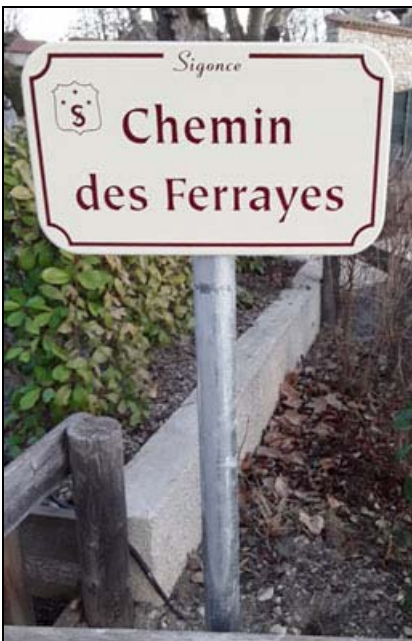
Plaque signalétique, sur support métallique, posée en janvier 2022.

Si vous habitez à la rue St Claude ou à la Placette et que vous allez par exemple vers Forcalquier vous pourrez partir directement par cette nouvelle voie en évitant ainsi de faire un grand détour.