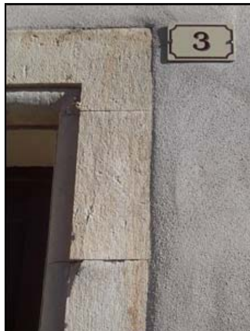
Les deux façades de la mairie avec leurs plaques numérotées.

Pour être plus clair la propriété Philippe Roche par exemple, (situation route de Montlaux tout près de l'usine à chaux), se trouve à 831 mètres de l'angle précité. Elle portera le numéro 831.