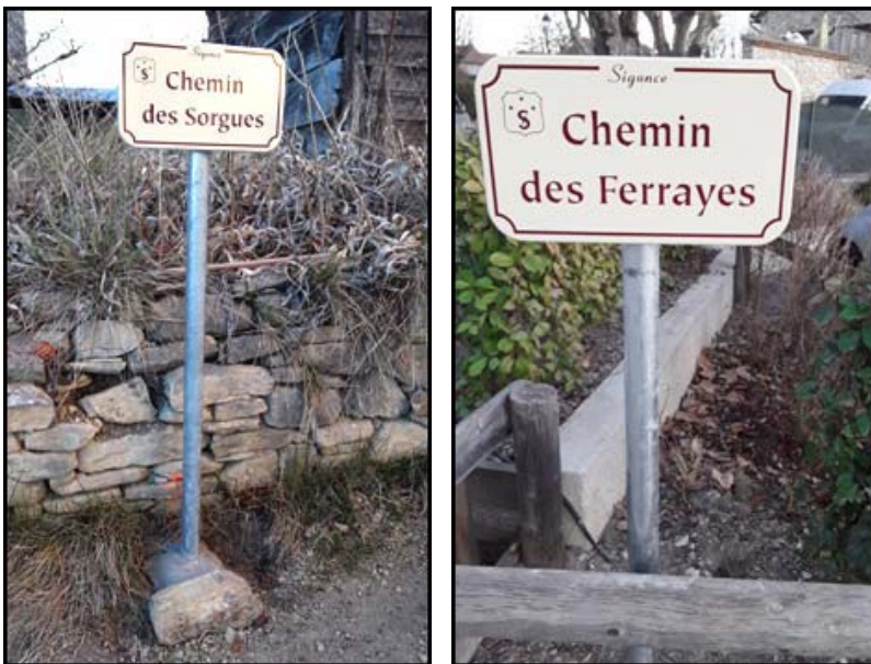
Exemple de fixation sur poteau.

De son côté, M. Roland Fauchier, l'employé municipal a mis en place et scellé les 51 plaques et panneaux qui portent les noms de toutes les rues du village. Les unes sont posées en façade, les autres fixées sur un poteau métallique de diamètre 60mm.