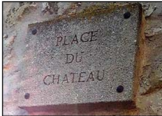
Anciennes plaques signalétiques en pierre.

Les noms avaient été gravés sur des plaques en pierre. Aujourd'hui elles sont remplacées par les nouvelles en métal qui répondent au plan préétabli par la mairie et à la nouvelle appellation des rues.