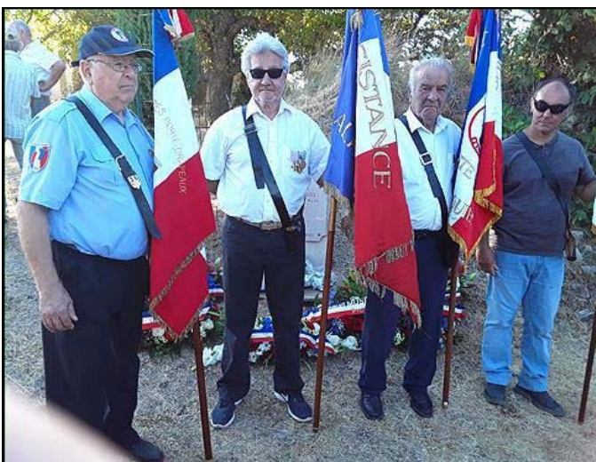
Photo des porte-drapeaux en fin de cérémonie devant la stèle avec les gerbes.