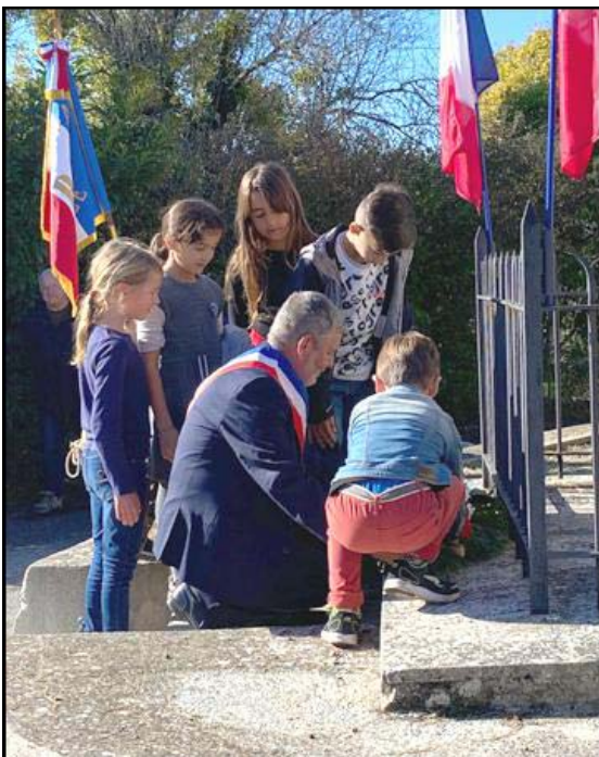
Le maire, entouré de quelques enfants dépose une gerbe de fleurs.