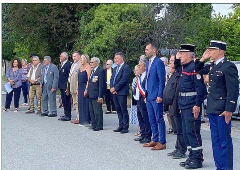
Pendant le recueillement.