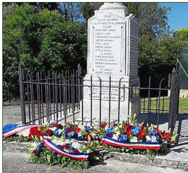
Pour ces héros du 8 juin 1944 : une stèle bien fleurie.