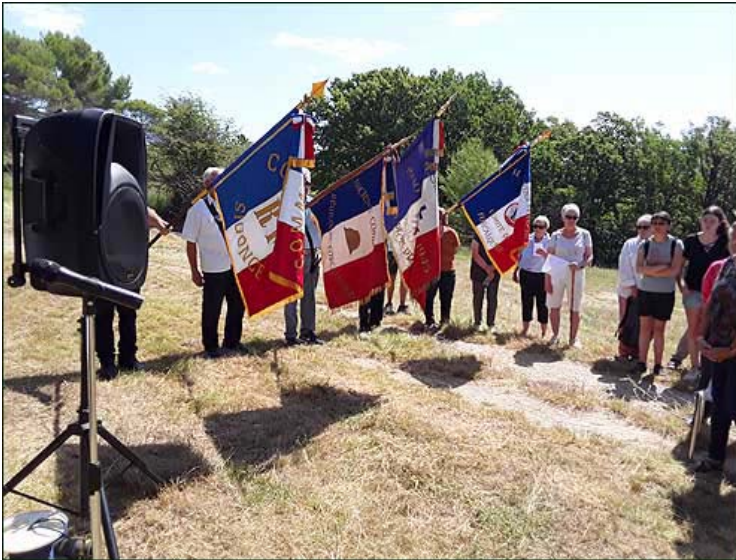
Drapeaux baissés pendant la sonnerie : "Aux Morts".