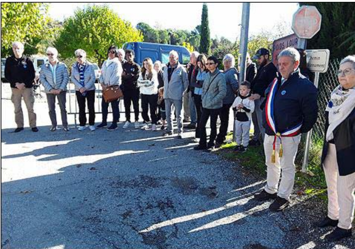
Une autre partie de l'assistance.