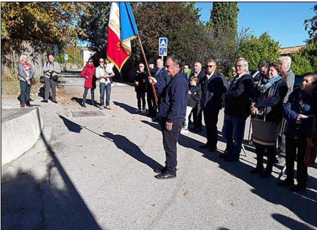
La partie gauche de l'assistance.

L'assistance se recueille pour cette 105 ème cérémonie commémorative de l'Armistice de 1918.