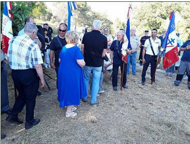
Les remerciements se succèdent.