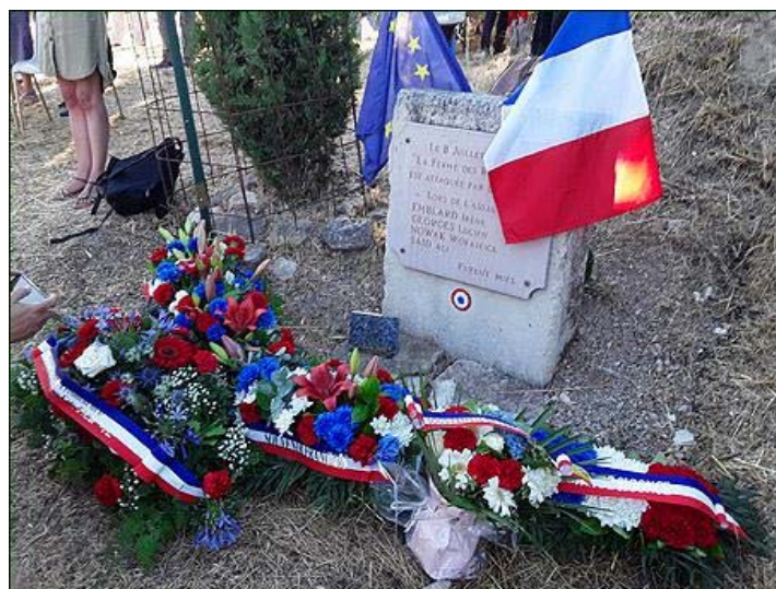
Une stèle bien fleurie.