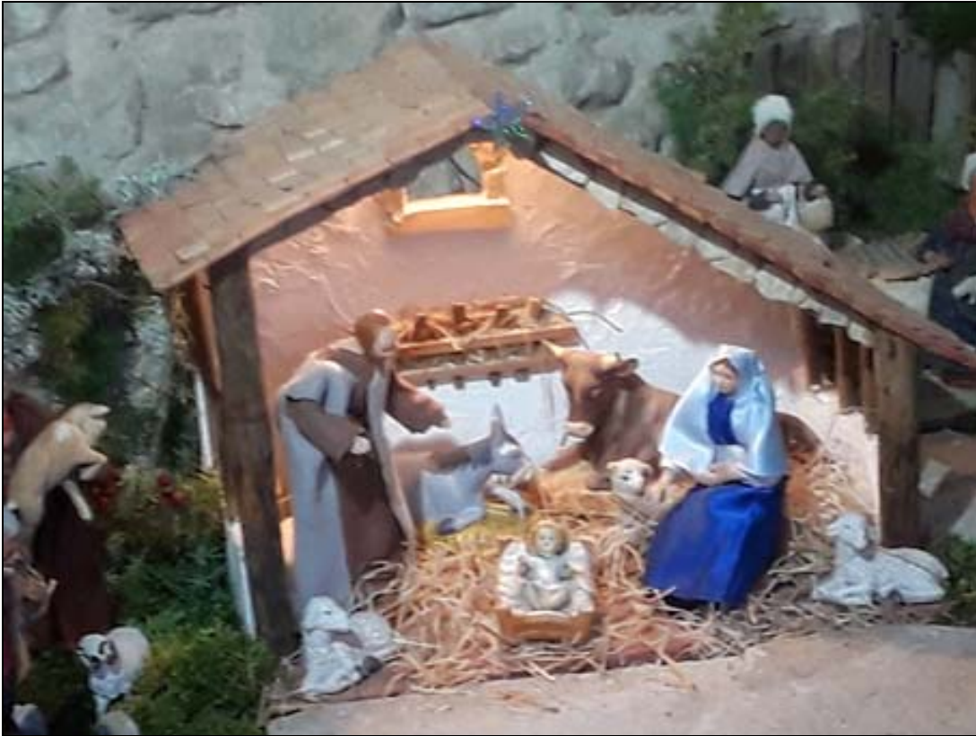
Il est né le divin enfant.