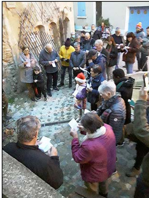
Une autre partie assistant à la cérémonie.

La crèche sera visible et admirée de jour comme de nuit jusqu'au dimanche 5 février 2023 inclus.