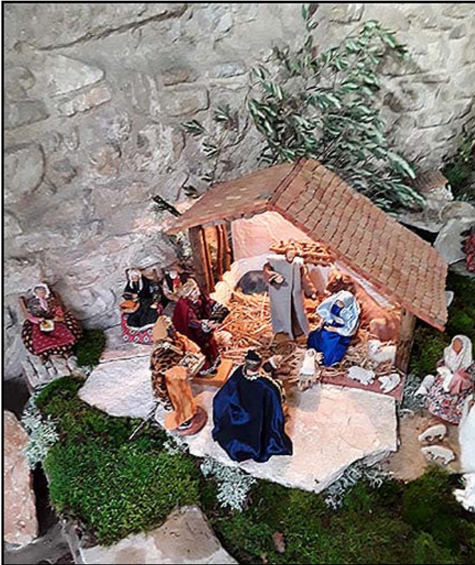
Le petit Jésus présent parmi nous en ce jour de Noël.