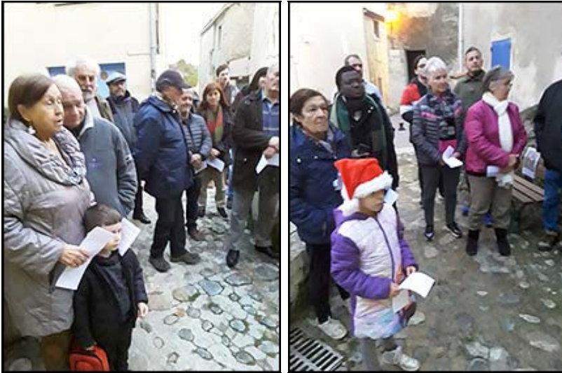
Une partie des fidèles présents.