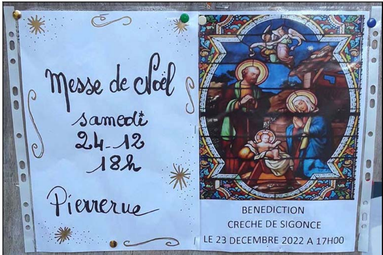
Affiche réalisée pour l'occasion.

Célébration de la Messe de Noël le samedi 24 décembre à 18h00 à Pierrerue. Bénédictio de la crèche de Sigonce le vendredi 23 décembre 2022 à 17h00.