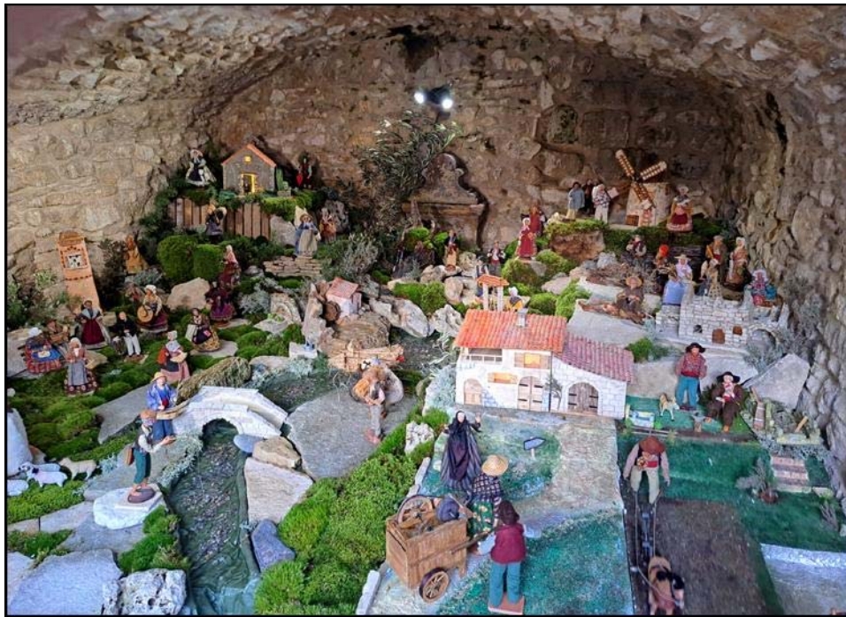
Tous occupés à leurs divers travaux attendent l'heureux événement.