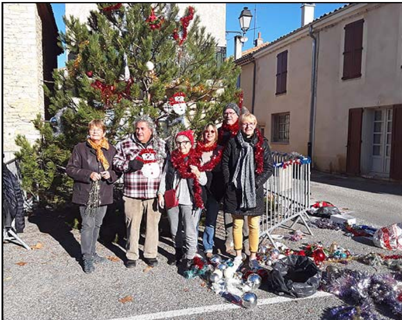
L'arbre de Noël en cours de décoration.