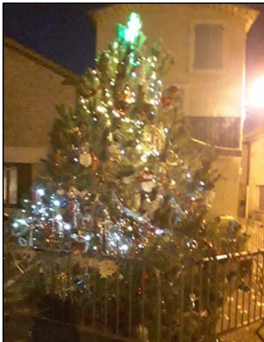
L'arbre de Noël vient d'être décoré.

Pour le plaisir des yeux, l'arbre de Noël scintillant de tous ses feux dans cette belle nuit de décembre.