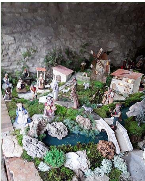
Tout ce petit monde attendant l'heureux évènement.