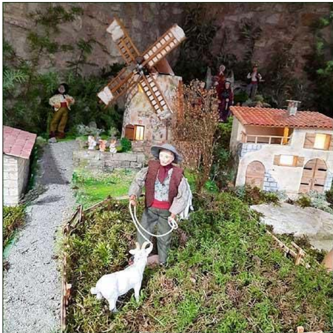
Représentation de celle-ci au milieu des santons.

La chèvre de M. Séguin que tous connaissent depuis leur tendre enfance.