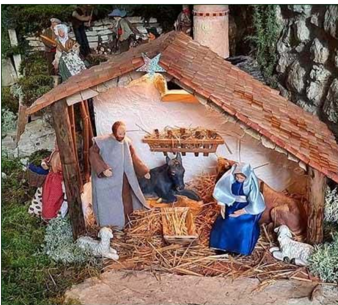
En attendant ... L'arrivée du petit Jésus.