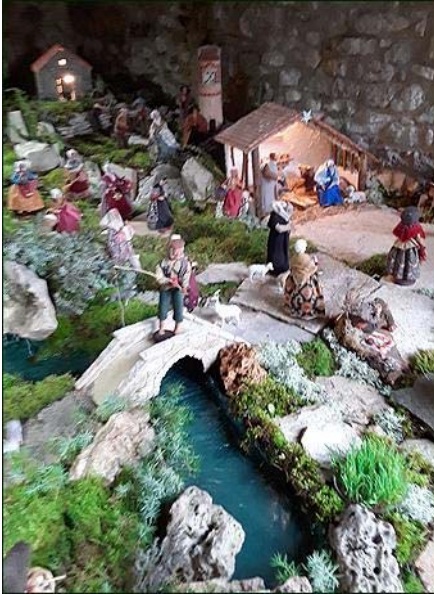
Le pêcheur va tenter sa chance.