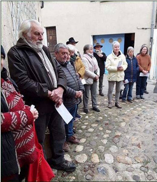
Ils ont participé à la cérémonie de bénédiction.