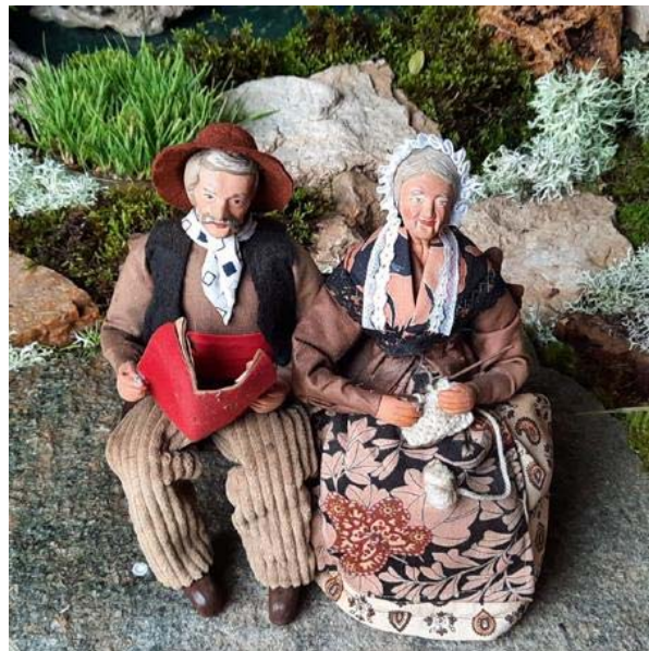
En attendant ... Vous pouvez remarquer la qualité des détails des costumes.