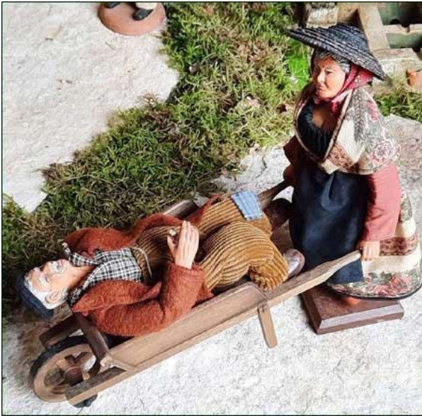
En attendant ... L'ambulance ramasse les excès.