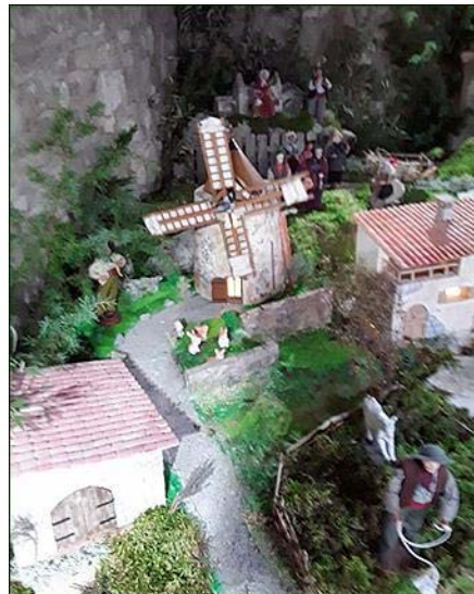
Le moulin à farine avec ses pales en mouvement.