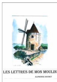
Les lettres de mon moulin, Alphonse Daudet.